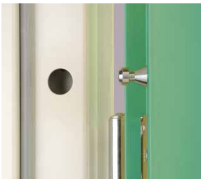
Hullingförsedda tappar i bakkant och gångjärn med säkrade sprintar ökar säkerheten.