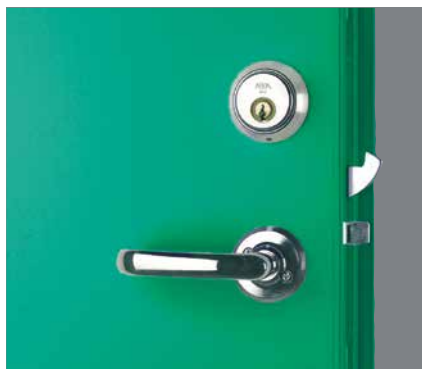
Låshus Assa Evolution 510.