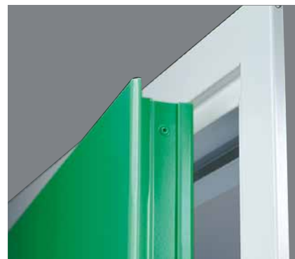
Dörrbladet sammanfogas utan synlig plåtkant och med fasad överfals.